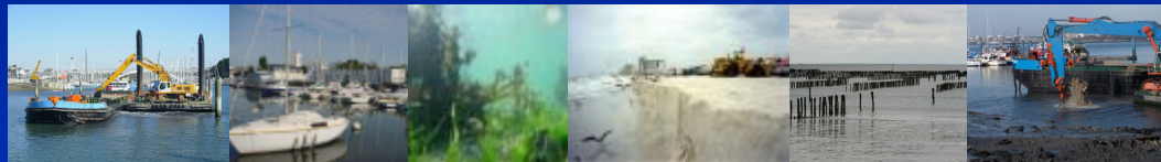
Schéma de référence des dragages du Morbihan